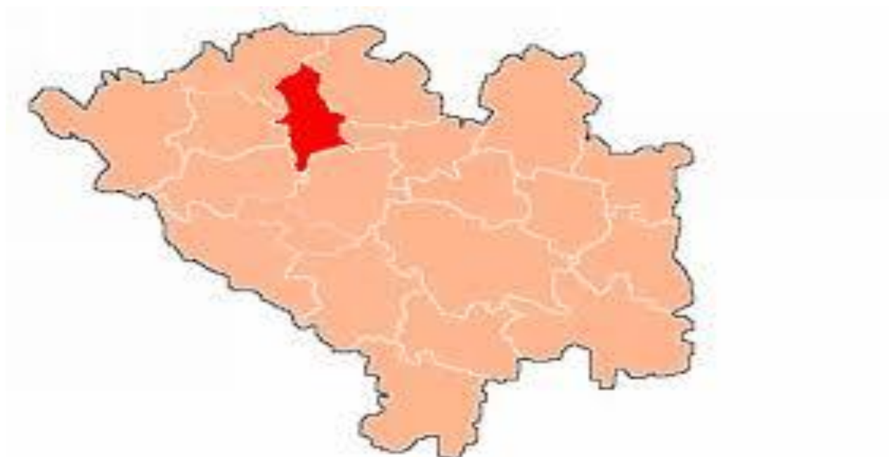
Rysunek 1. Położenie Gminy Miedziana Góra w powiecie kieleckim.