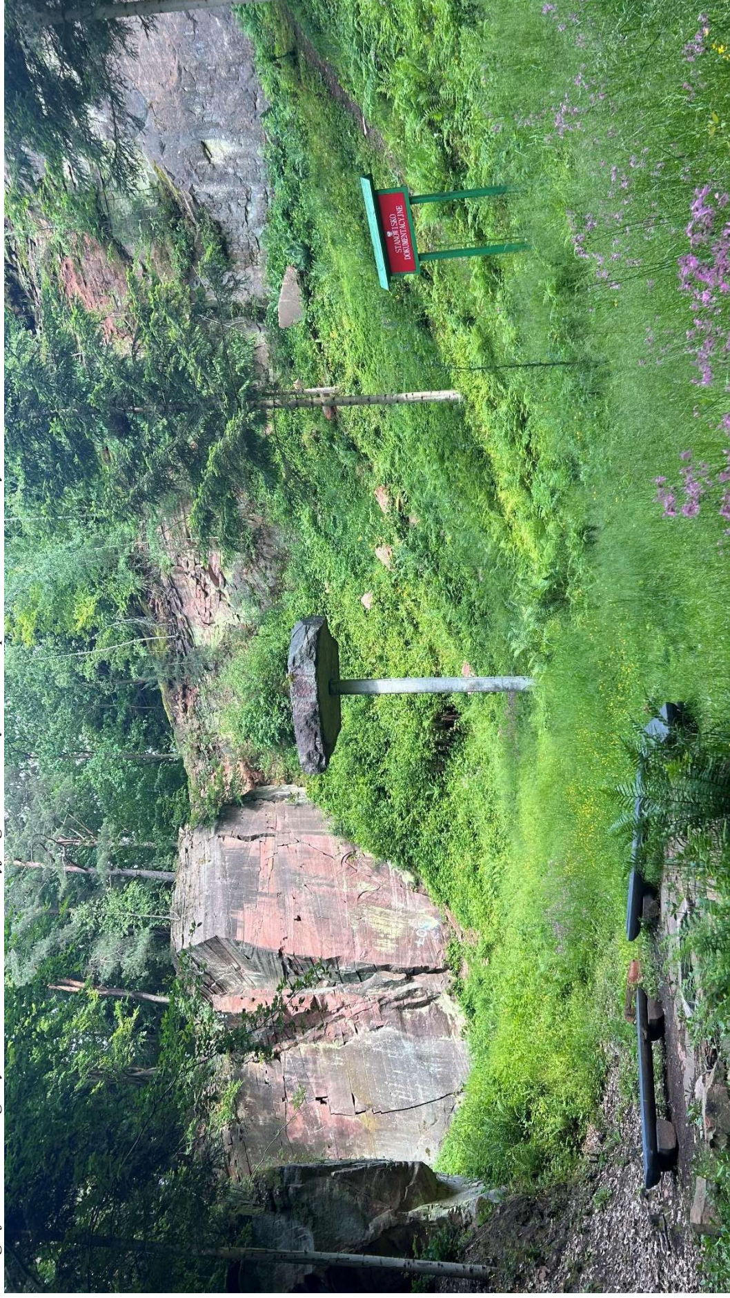
Fotografia 1. Widok ogólny stanowiska dokumentacyjnego „Odsłonięcie skalne piaskowców triasowych”.