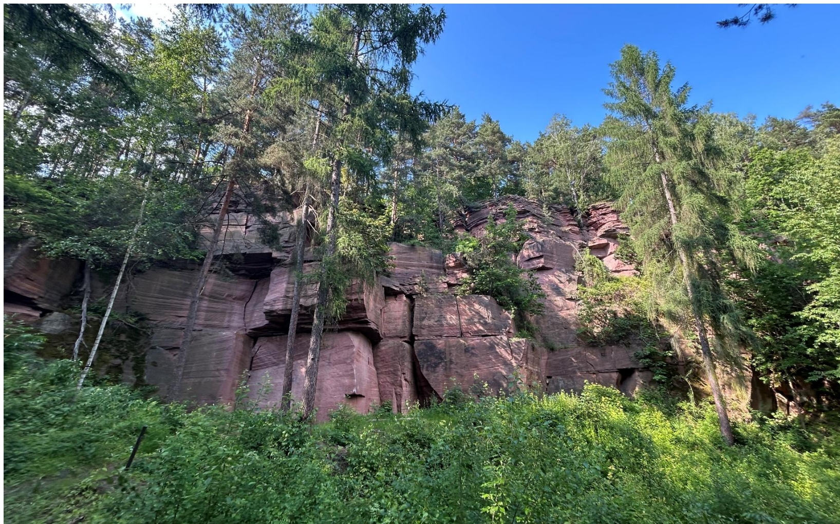
Fotografia 1. Widok ogólny pomnika przyrody „Kamieniołom Ciosowa”

Załącznik nr 1 do Uchwały Nr XXVIII/276/26 Rady Gminy Miedziana Góra z dnia 26 marca 2026 r.