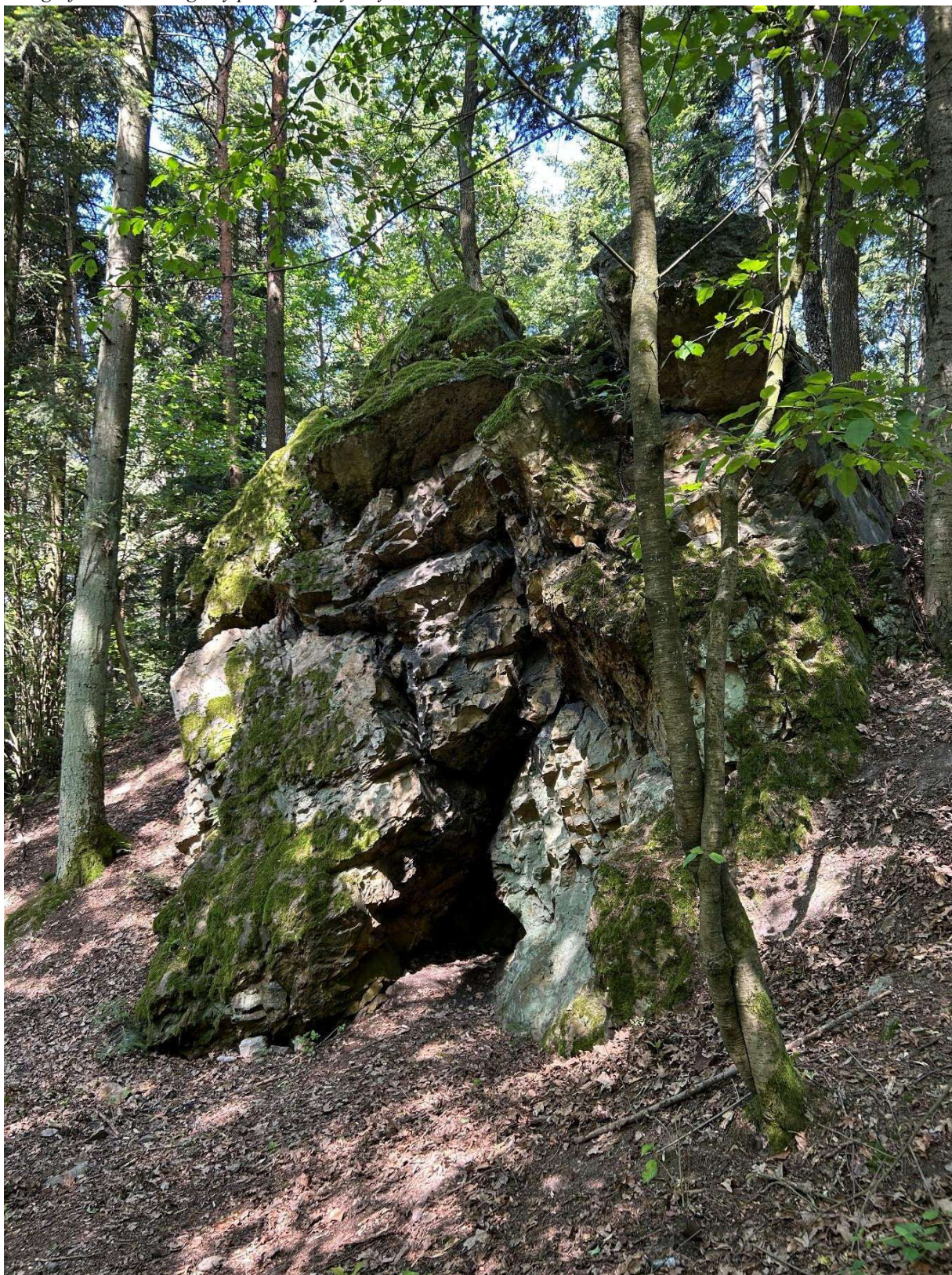
Fotografia 1. Widok ogólny pomnika przyrody „Urwisko skalne Piekło”.