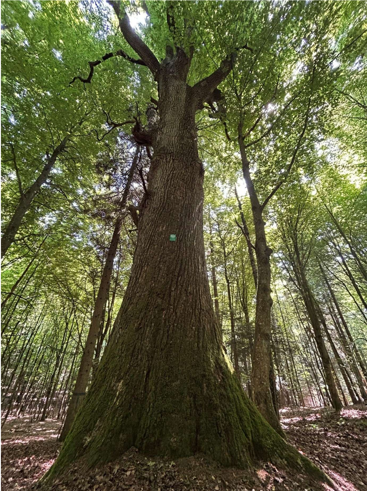
Fotografia 1. Widok ogólny pomnika przyrody „Radziej”.

Załącznik nr 2 do Uchwały Nr XXVIII/280/26 Rady Gminy Miedziana Góra z dnia 26 marca 2026 r.