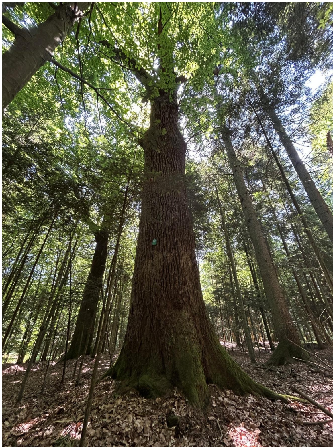
Fotografia 1. Widok ogólny pomnika przyrody „Miedziar”.

Załącznik nr 2 do Uchwały Nr XXVIII/281/26 Rady Gminy Miedziana Góra Z dnia 26 marca 2026 r.