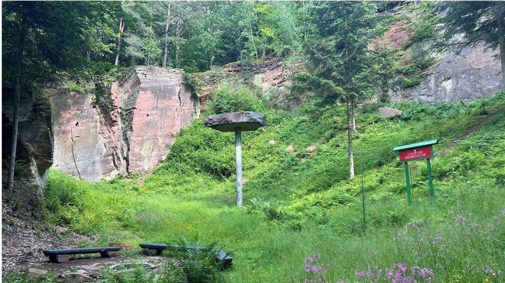
Fotografia 1. Widok ogólny stanowiska dokumentacyjnego „Odsłonięcie skalne piaskowców triasowych”.

Załącznik nr 1 do Uchwały Nr XXVIII/282/26 Rady Gminy Miedziana Góra z dnia 26 marca 2026 r.