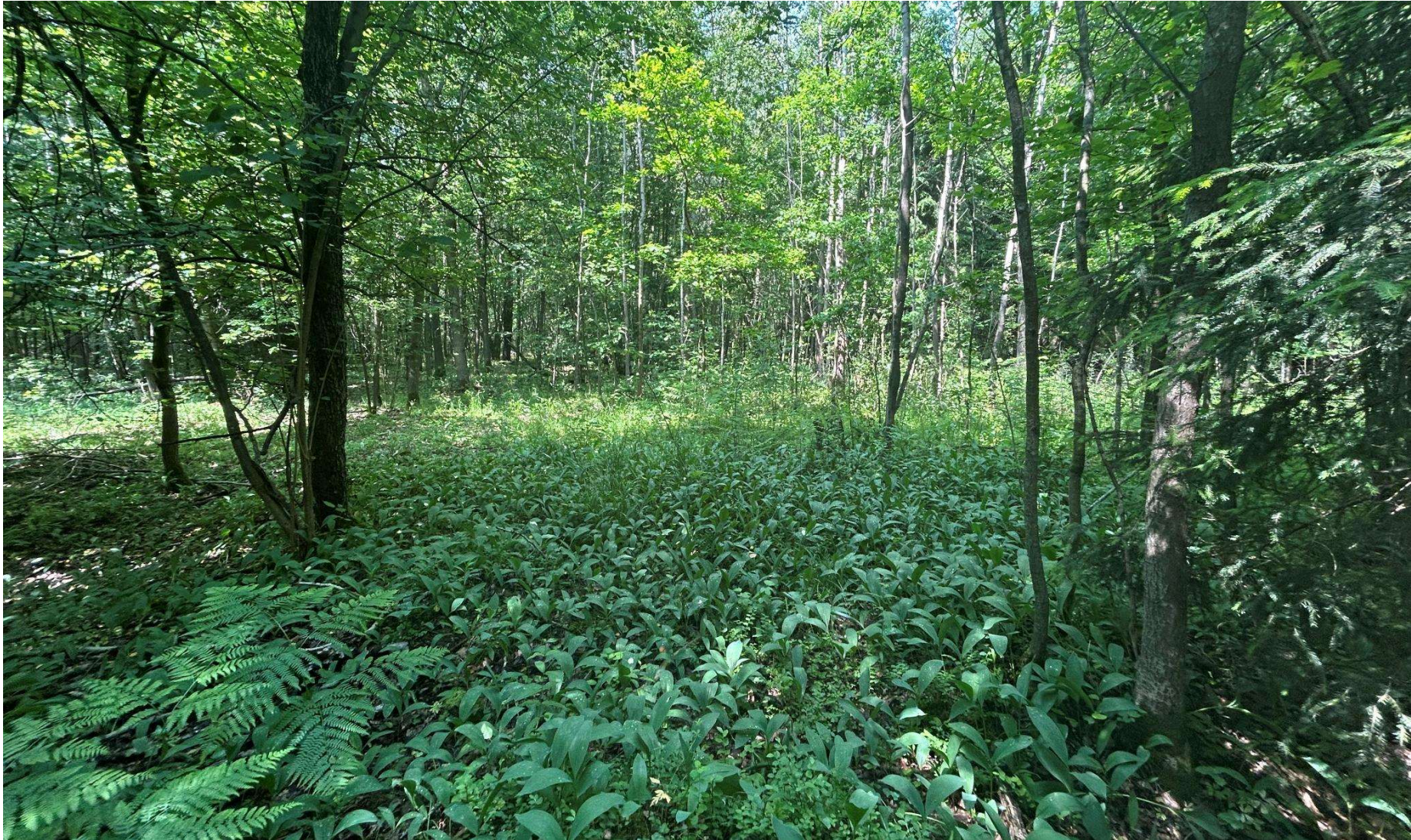
Fotografia 1. Widok ogólny użytku ekologicznego „Ostoja Horezińska”.